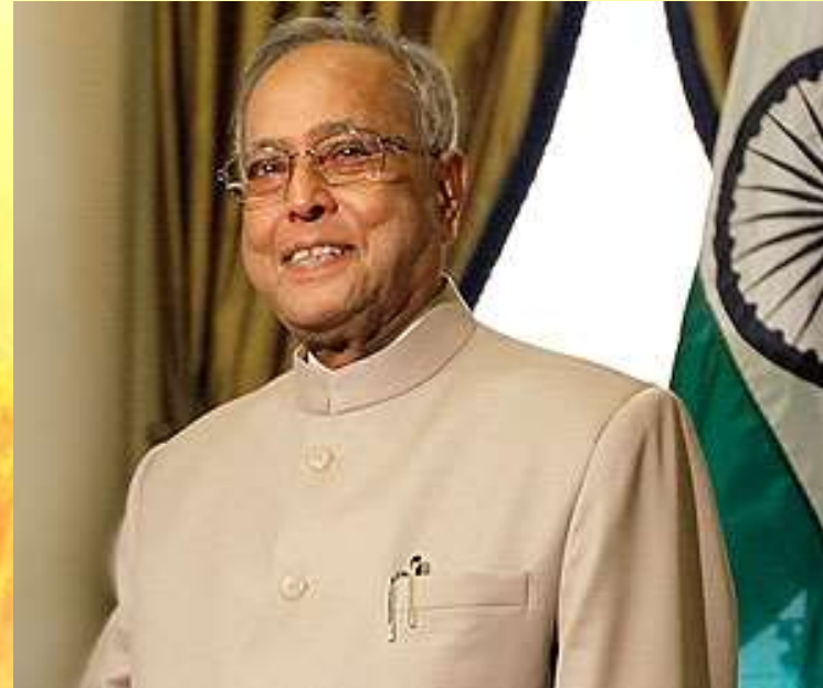
Президент-Пранаб Кумар Мукерджи

Главой государства является президент Индии, который избирается электоральной коллегией сроком на 5 лет путём непрямого голосования. Главой правительства является премьер-министр, которому принадлежит основная исполнительная власть.