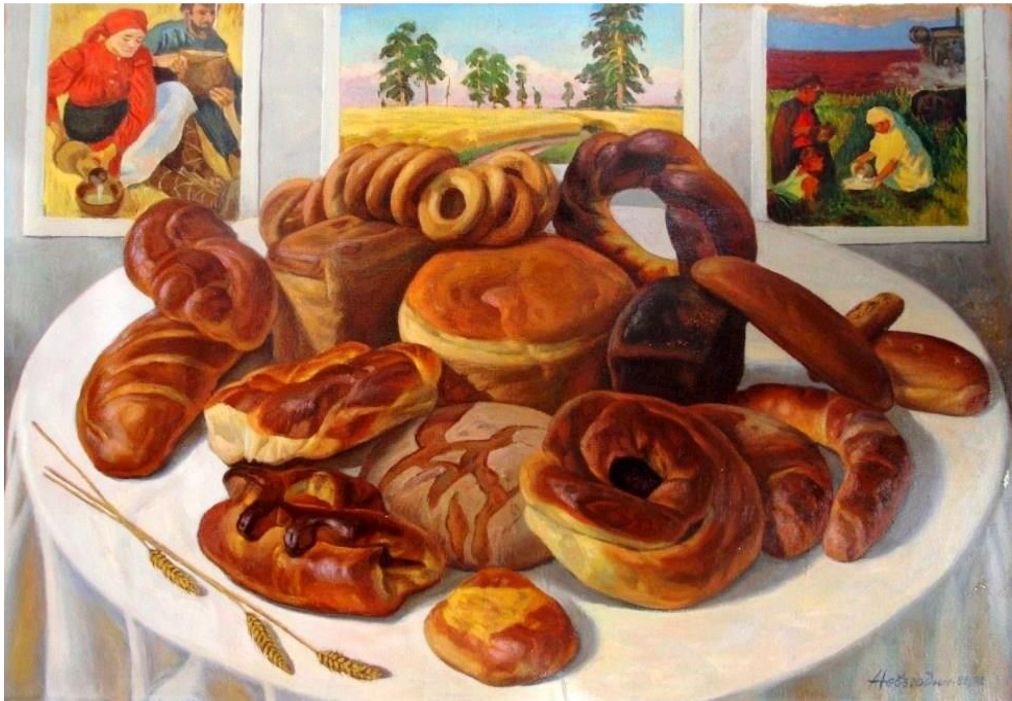
«Сибирский хлеб». Невзгодин А.Н.