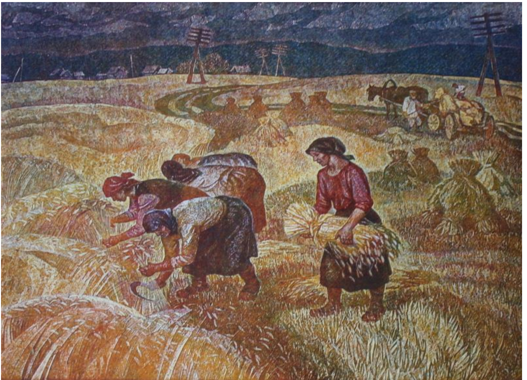
Трудный хлеб. Автор неизвестен.