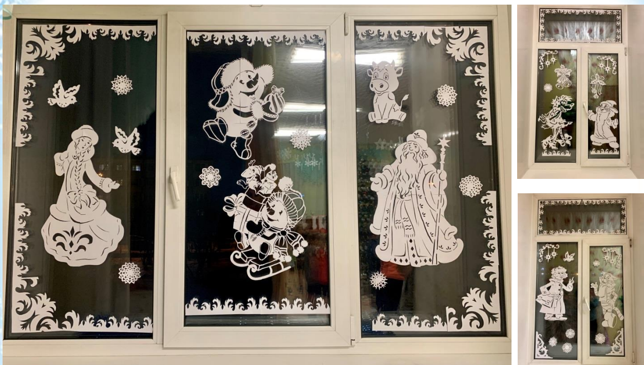
Оформление окон «Морозные узоры»