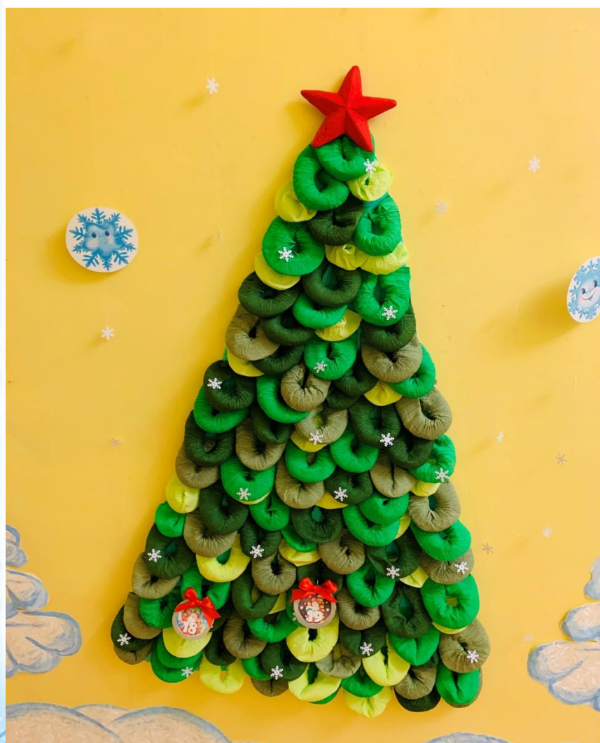
Коллективная работа «Елка-календарь»