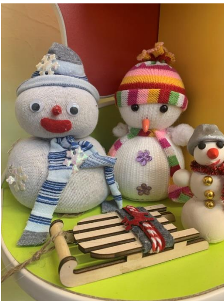
Подделки «Снеговик» (из творческого материала)