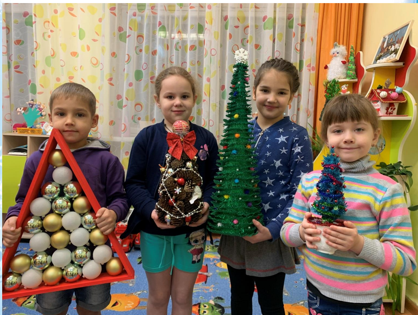
Творческие семейные работы для выставки-конкурса «Елочка – зеленая иголочка»