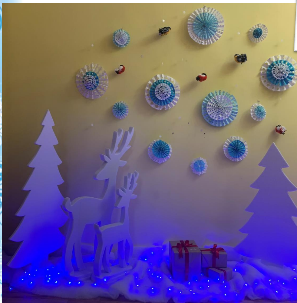
Фото-зона «Зимняя сказка» (Все элементы и фигуры фото-зоны ручная работа)