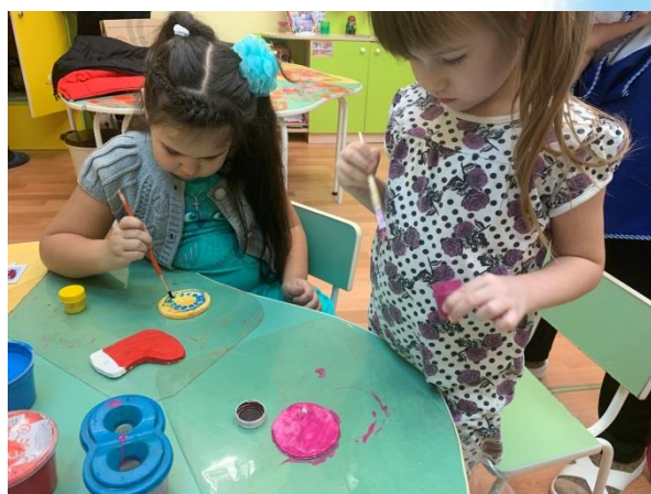
Роспись игрушек для елки из соленого теста