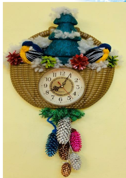
Украсили часы в группе