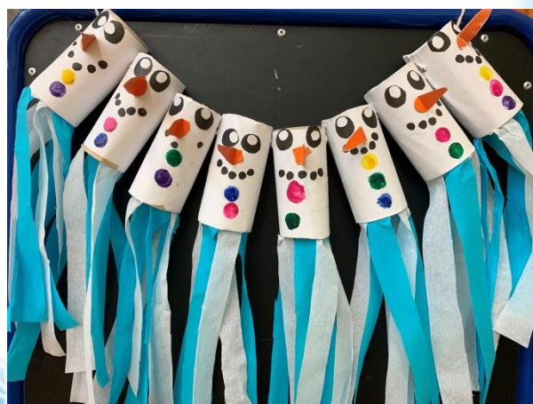
Объемная аппликация из бумажных втулок «Снеговички - ветрячки»