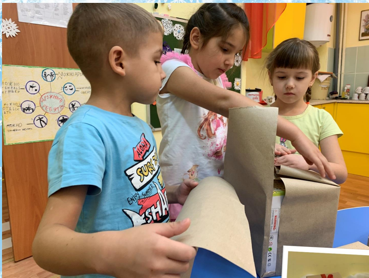
Изготовление элементов фото-зоны «Подарки»