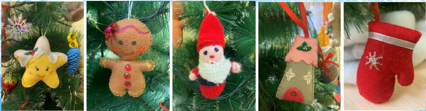
Детско-родительские поделки для групповой елки