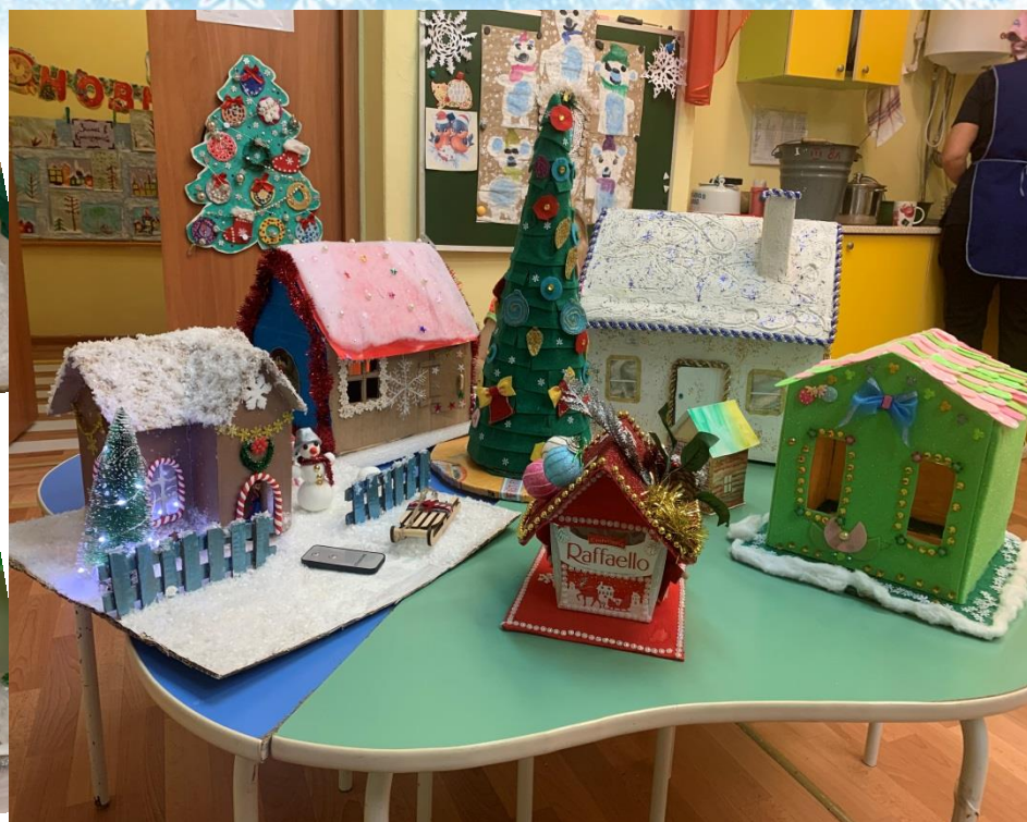
Творческие работы для выставки «Зимние сказочные домики»